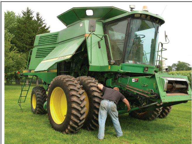
L'entretien préventif permet d'éviter des pannes coûteuses.

Pour des programmes d'entretien particuliers, consulter les manuels d'utilisation et communiquer avec le concessionnaire de la machinerie.