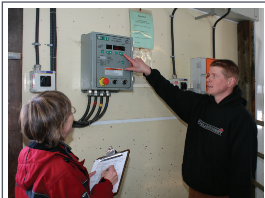
Le calcul de la consommation réelle d'énergie représente la première étape dans l'amélioration de l'utilisation d'énergie dans l'exploitation.