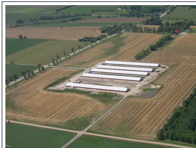
Une construction de qualité réduira les coûts énergétiques tout en maximisant la vie utile des bâtiments agricoles.