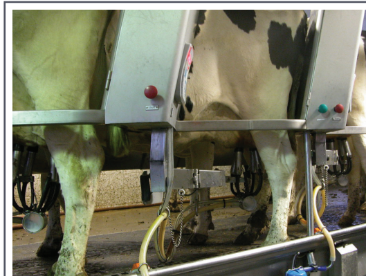
Dans les fermes laitières, le centre de traite est l'un des plus gros consommateurs d'énergie.