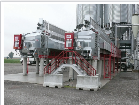
Les séchoirs à grains à haute température peuvent être modifiés pour en améliorer l'efficacité énergétique.

L'énergie requise pour sécher des grains semblables varie beaucoup quand on a recours au séchage à haute température. Des modifications peu coûteuses peuvent réduire la consommation de carburant sans réduire la capacité de séchage.